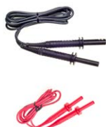
Cavo 5 kV 1,8 m (terminali banana) nero schermo / rosso