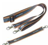
L2 cinghie di supporto (set)