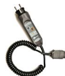
WS-03 adattatore con pulsante di START e spina UNI-SCHUKO